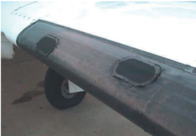
Bota de deshielo con parches de reparación