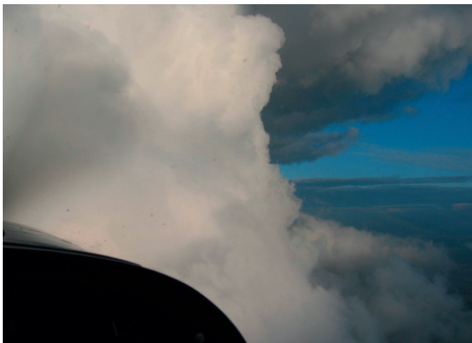
Las nubes convectivas pueden evitarse en vuelo visual

Un escenario típico de encuentros con zonas de formación de hielo son las nubes convectivas que se desarrollan por encima del nivel de congelación en un día con atmósfera inestable. Si su nivel de crucero está por encima del nivel de congelación, pero por debajo del techo de nubes, se enfrenta a la posibilidad de formación de hielo. Cuando las nubes convectivas están dispersas y es posible verlas, pueden evitarse, al igual que las condiciones de formación de hielo asociadas a las mismas. Sin embargo, tenga en cuenta que esto requiere contar con condiciones visuales y que cualquier acumulación de hielo en el parabrisas restringe la visibilidad.