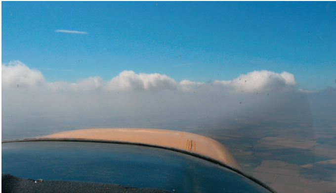
Nubes de tipo estratocúmulo a la vista

El techo de las nubes de tipo estratocúmulo, especialmente las que se encuentran justo debajo de una zona de inversión térmica, a menudo contiene altas concentraciones de agua líquida superenfriada. Su gran amplitud horizontal significa que la zona de formación de hielo es continua, y que solo un cambio de nivel de vuelo conseguirá aliviar las condiciones de formación de hielo.