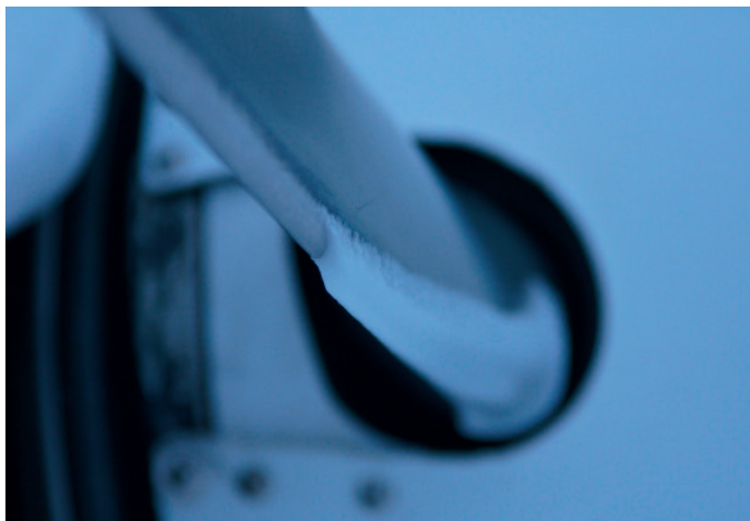
Hielo en la pala de una hélice

Si se acumula hielo en una hélice sin protección, la pérdida de empuje puede ser tan significativa que puede que usted no sea capaz de ascender por encima de la zona donde se dan las condiciones de formación de hielo, o incluso que no pueda mantener la altitud.