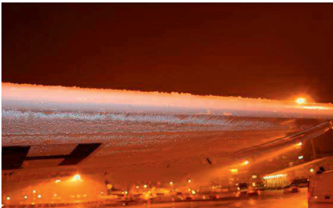
Hielo formado en vuelo tras el aterrizaje

Este folleto ha sido elaborado por el Equipo Europeo de Seguridad de la Aviación General, EGAST, y está destinado a proporcionar orientación a los pilotos de aeronaves no complejas carentes de sistemas modernos de protección anti-hielo que pueden encontrarse con formación de hielo en vuelo en la estructura externa del avión.