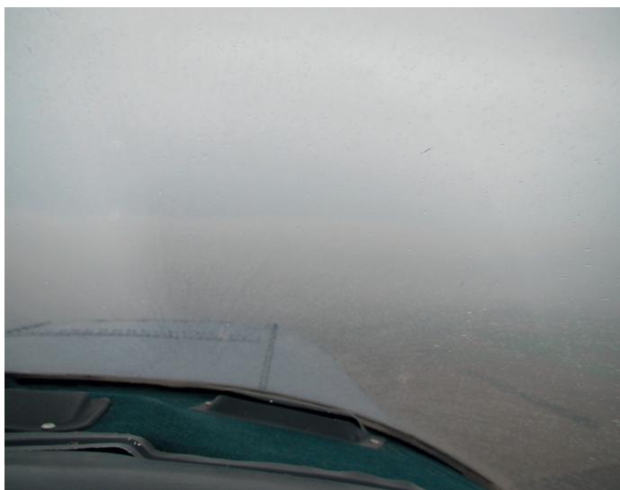
Vuelo con humedad visible

También pueden encontrarse indicativos de formación de hielo en el cono de la hélice o en el marco del parabrisas. Los pilotos deben aprender a reconocer dónde empieza a formarse el hielo en su aeronave, y buscar señales visuales de esta formación, porque la performance puede verse degradada con solo pequeñas acumulaciones de hielo. Un milímetro de hielo es suficiente para alterar el comportamiento de algunas superficies aerodinámicas modernas.