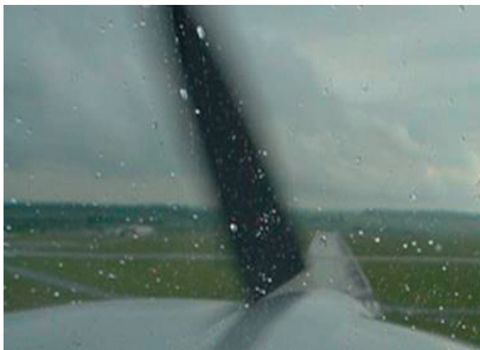
Debe evitarse la lluvia en condiciones por debajo del punto de congelación

Por lo general, es más problemático ascender a través de una capa fina con condiciones de formación de hielo que descender a través de una. Durante el ascenso, la velocidad es normalmente más baja, por lo que el fuselaje está más frío y el ángulo de ataque expone más superficie del ala a una posible acumulación de hielo. La velocidad vertical está limitada por la performance de la aeronave, y la tasa de ascenso se reduce de forma progresiva a medida que se forma hielo, aumentando el tiempo que se pasa en la capa donde se dan condiciones de formación de hielo. La