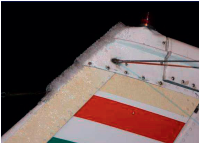
Hielo en superficies aerodinámica de pequeño radio de curvatura

La velocidad con la que el hielo se acumula depende de las condiciones atmosféricas, pero la forma geométrica de las áreas donde se forma afecta tanto a la velocidad de acumulación como a la gravedad de esta acumulación de hielo. El hielo suele acumularse primero en partes de la estructura con un radio de curvatura pequeño, de forma tal que se formará en el plano de cola antes que en el ala. La primera indicación de formación de hielo suele ser la presencia de hielo en pequeñas protuberancias como un sensor de temperatura o el tope de una puerta.