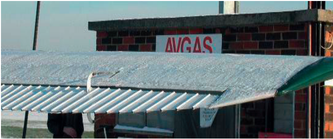
Ala con escarcha

Cuando se usen este tipo de fluidos, aumente la velocidad de rotación y prevea un aumento de la distancia de despegue y/o la necesidad de aplicar una mayor fuerza para mover los mandos de vuelo.