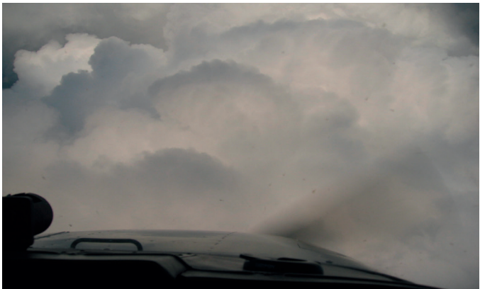
Parte superior de un cúmulo en desarrollo

hielo, existe la posibilidad de volar a través de ella sin encontrar agua líquida superenfriada. En la parte superior de las nubes de chubasco que ha cristalizado (se ha convertido en cristales de hielo, con aspecto tenue) se crean, por lo general, condiciones de hielo menos graves que en la parte superior “burbujeante” (o en forma de «coliflor») de un cúmulo en desarrollo.